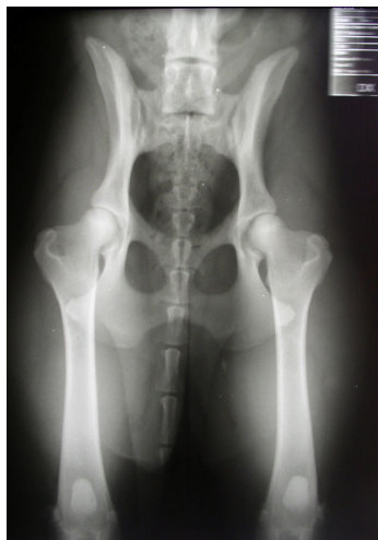
obr. Rentgenový snímek zdravého slovenského čuvače. V pravém horním rohu je vidět nezaměnitelné označení snímku.