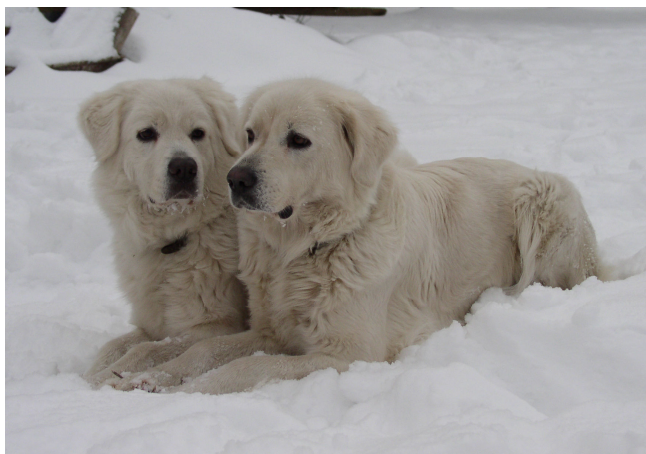
obr. Slovenské čuvačky Ch. Essy Bílé království a Jch. Akki Bílé království

Jednoduchý přehled uchovnění feny : viz další stana